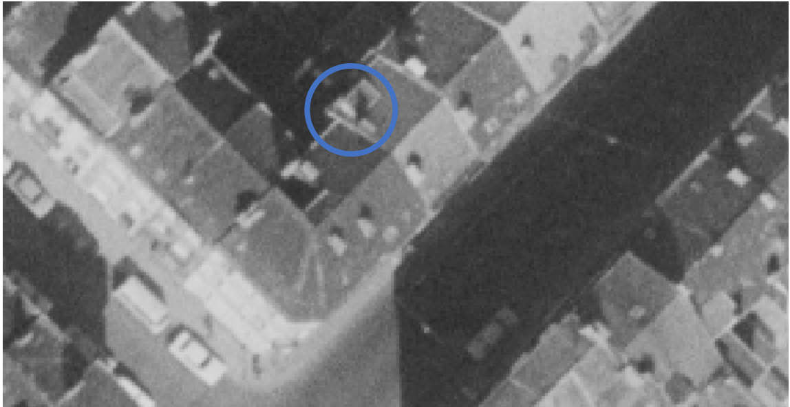
Rue de Roumanie 23 en 1977 ; orthophotoplan disponible sur la plateforme BruGIS, le 25 mars 2025.

Considérant l'avis de la commission de concertation du 16 septembre 2025, nous avons décidé de supprimer les deux lucarnes existantes et les remplacer par de fenêtres de toit axées, dans la mesure du possible, sur les baies des étages inférieures.