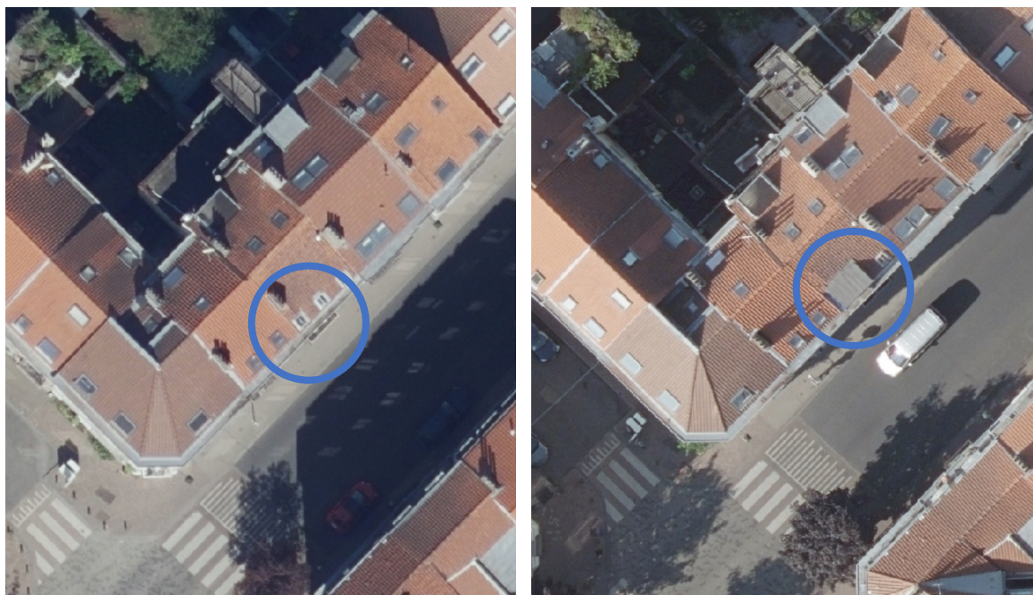
Rue de Roumanie 23 en 2019 et en 2020 ; orthophotoplans disponibles sur la plateforme BruGIS, le 19 mars 2025.

Bien que cette lucarne située sur le versant avant ait été construite entre 2019 et 2020, comme le confirment aussi les orthophotoplans disponibles sur la plateforme BruGIS, la lucarne arrière semble être en place depuis au moins 1977.